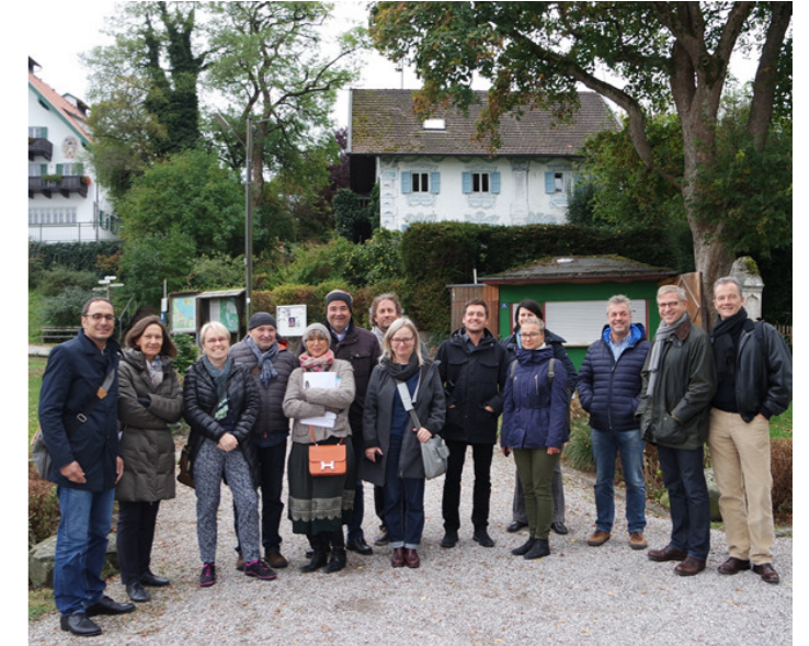
Mit den Vertretern der Planungsbüros beim Dorfspaziergang.

folgt ein Vorschlag an den Gemeinderat für die Auswahl des für Seeshaupt am geeignetsten erscheinenden Büros. Nach einem noch zu fassendem Beschluss im Gemeinderat hoffen wir, dass im Frühjahr 2017 ein passendes Planungsbüro mit den lange erwarteten Arbeiten beginnt.