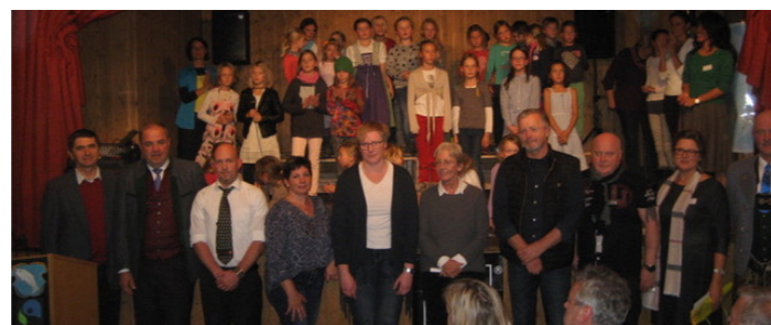
Die Unterstützer von Pfarrgemeinde, Gemeinde, Tengelmann, Nachbarschaftshilfe, Hotel Garni Sterff, Südsee e.V., Würmsee-Stüberl, Grundschule und Trachtenverein