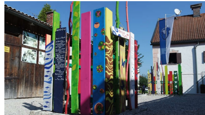
„Kunst am Bau“ – Vielen Dank an die Gruppe Farbenspiel!

Noch ist das Platzl nicht ganz fertig. Im Herbst suchen wir noch einmal Helfer, um wie geplant Bäume zu pflanzen!